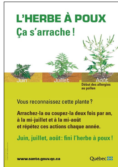
Fig.2— Affiche de sensibilisation du public utilisée au Québec

La mesure de contrôle de l'ambroisie qui est privilégiée est la coupe des plants 2 fois par année, ciblées les 15 juillet et 15 août (+/- 7 jours) (Fig. 2) correspondant aux périodes québécoises (et non françaises) de la première floraison de la plante et de la deuxième floraison suite à sa repousse. Sachant que l'ambroisie est une plante indigène au Québec, il est impossible d'envisager son éradication. Nous avons une vision axée davantage sur l'entretien adéquat des terrains afin de s'assurer du maximum de réduction des quantités de pollen émis dans l'air, que sur des actions d'élimination de la plante. Des actions préventives sont également mises en place par endroits, comme l'ensemencement compétitif.