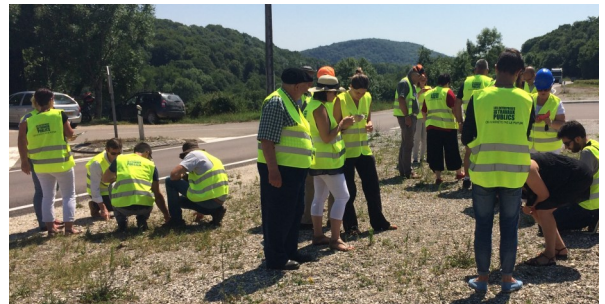
Fig. 4— Arrachage sur une station en bord de route sur une commune proche de Besançon - Larnod (25)

La journée s'est terminée par une session d'arrachage de l'ambroisie sur une station en bord de route (Fig. 4) .