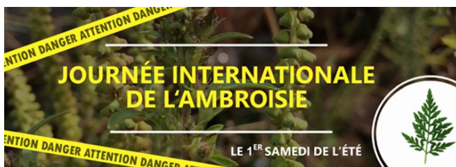
Figure 2 – La journée internationale de l'ambrosie 2018

Chaque premier samedi de l'été a lieu la Journée internationale de l'ambrosie. Aux alentours du 23 juin, des animations sont organisées un peu partout en France pour informer le grand public et les professionnels sur les problèmes générés par l'Ambrosie à feuilles d'armoise et pour encourager la mise en place d'actions de lutte.