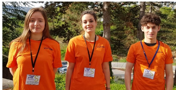
Figure 2 - Les nouvelles recrues en service civique de l'ARS AuRA pour parler des ENSH.

L'ARS et ses partenaires sont engagés depuis plusieurs années dans la lutte contre les