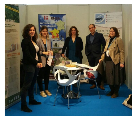
Figure 1 - Stand de l'Observatoire, partagé avec le RNSA et l'APPA, lors du Congrès Francophone d'Allergologie.

Sur 67 allergologues, 44 recherchaient effectivement l'ambrosie, soit environ 66% des médecins allergologues interrogés. Ceux ne recherchant pas cet allergène étaient majoritairement situés dans des régions où l'ambrosie n'est pas ou peu présente. Ce fut l'occasion pour notre équipe de sensibiliser les allergologues sur la progression de l'ambrosie en France et leur faire prendre conscience qu'ils sont parfois plus concernés qu'ils ne le pensaient sur leur territoire !