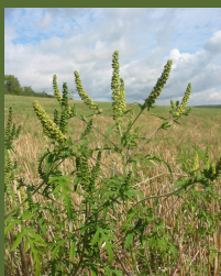
Ambrosia artemisiifolia L.