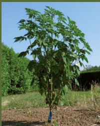
Ambrosia trifida L.