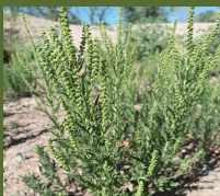
Ambrosia psilostachya DC.