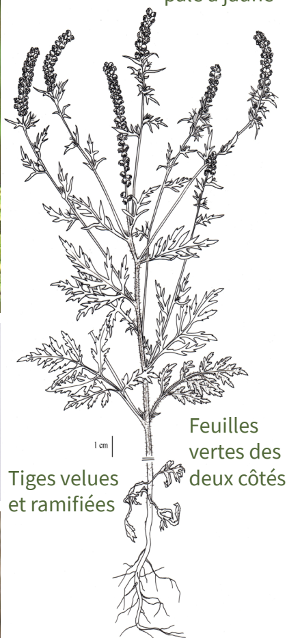
Tiges velues et ramifiées