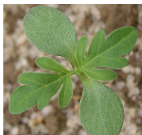
Sa hauteur varie de 0,2 m à 2 m