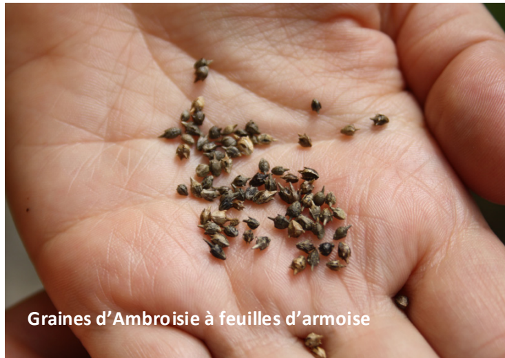
Graines d'Ambrosie à feuilles d'armoise

Attention, vous pouvez observer deux types de graines d'ambrosie dans les sachets :